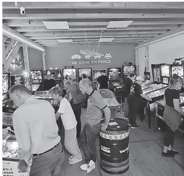
Viel Betrieb bei den Ehrenamtstagen im Flippermuseum

Die DSEE hat die Ehrenamtstage für ehrenamtlich Tätige im Flippermuseum unterstützt.